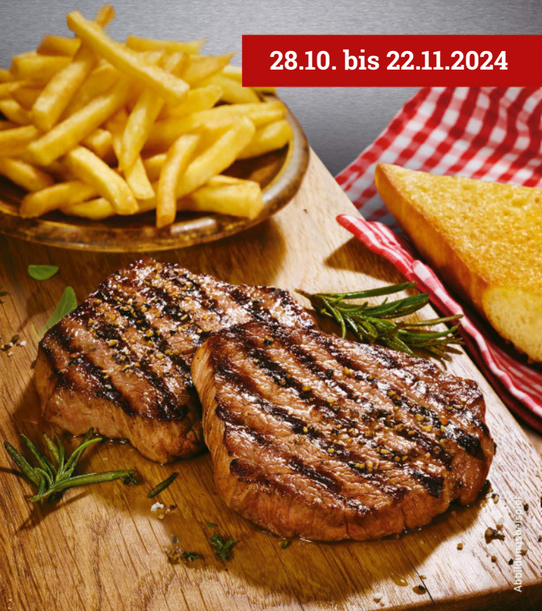
Abbildung ist beispielhaft